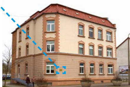
1. Haus des Spar- und Bauvereins in der Halleschen Straße 69, erbaut 1901/1902

Gleichzeitig müssen aber auch Jahresabschlüsse erstellt und geprüft werden, das Tagesgeschäft muss reibungslos weiterlaufen und eine riesige Menge Daten muss von einem Programm in ein Neues übergeleitet werden.