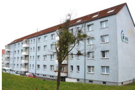
Objekt Käthe-Kollwitz-Straße 23–25 in Bleicherode im jetzigen Zustand

Neue Balkone und viel frische Farbe werden die Häuser in der Käthe-Kollwitz-Str. 23–25 im neuen Glanz erstrahlen lassen.