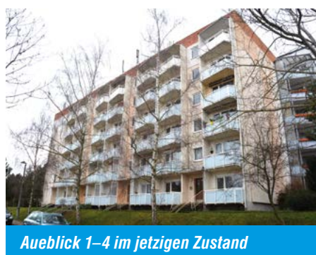
Aueblick 1–4 im jetzigen Zustand

Darüber hinaus sind in diesem Jahr Ausgaben in Höhe von rund 6,85 Mio. Euro vorgesehen. Den größten Anteil an den Ausgaben für die Bautätigkeit stellt der dritte und letzte Bauabschnitt unseres Projektes „Seniorenwohnen am Aueblick“ dar. Hier wird das Haus Aueblick 1–4 analog der Hausnummer 5–8 einer sehr umfangreichen Sanierung und Modernisierung unterzogen und mit vier Personenaufzügen ausgerüstet.