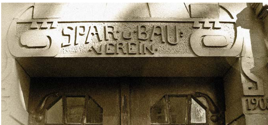
Gründung des 1. Spar- und Bauvereins in Nordhausen, am 10. April 1901