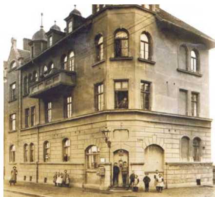
Alte Fotoaufnahme, Hallesche Straße 77

mit welchem wir Mietverträge verwalten, Betriebskostenabrechnungen erstellen, Instandhaltungsaufträge auslösen und abrechnen und die gesamte Geschäftsbuchhaltung abwickeln, nun nach 20 Jahren durch ein neues, moderneres Programm ersetzen müssen.