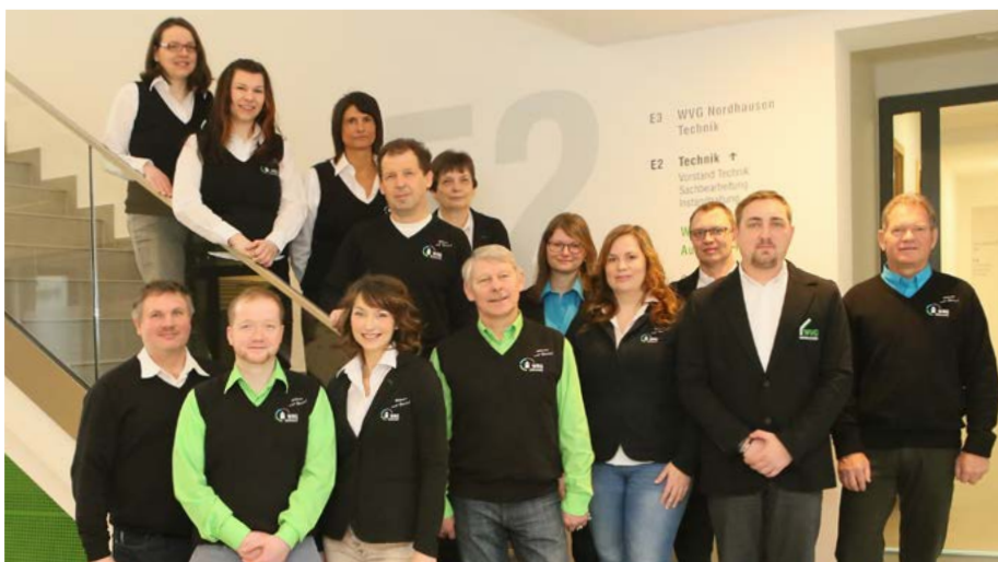
Unsere Teamleiter der einzelnen Fachbereiche der WBG Südharz stellen sich vor

Unsere Teamleiter haben diese Herausforderung angenommen und erfolgreich im Unternehmen umgesetzt .