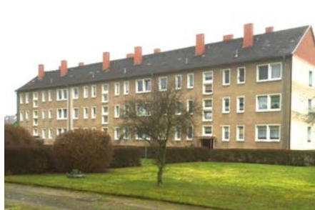
Harzstraße 13–17 im jetzigen Zustand

In Rottleberode werden in der Harzstraße 13–17 neue Balkone angebaut und die Fassade gedämmt .