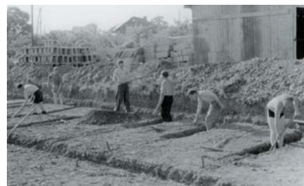
Genossenschaftsmitglieder bei der Leistung von Aufbaustunden

stehen ließen, konnten alle Hemmnisse überwunden werden.