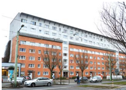
Objekt Töpferstraße im jetzigen Zustand

Eine anspruchsvolle Aufgabe wird auch die Auffrischung der „Wohnscheibe“ Töpferstraße 11–18 in Nordhausen.