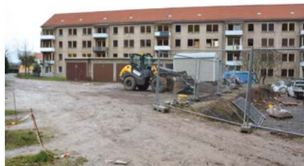
Parkanlage Bleicherode im jetzigen Zustand

Weiterhin ist die Fertigstellung des Objektes Löwentorstraße 2–2c in Bleicherode und die sich dort anschließende komplette Neugestaltung des Wohnumfeldes als Großmaßnahmen zu benennen.